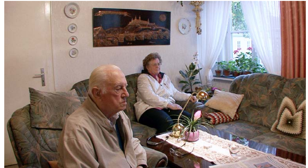
Filmstills „New German Washout“: (oben) Familie L., (unten) aus Breuersbrock/Henning „Mythos für Millionen – Der VW Käfer“, 1995

Die Menschen in Wolfsburg hatten keine traditionellen Bindungen. Ihre Heimat lag woanders und war unerreichbar. In den modernen Wohnblöcken hatten sie zwar schöne Wohnungen, trotzdem schauten sie sehnsüchtig nach Braunschweig oder auf die Fachwerkhäuser von Celle. Vor Weihnachten fuhr auch Herr B. immer nach Braunschweig, da gab es Lichterglanz und Weihnachtsmarkt; in Wolfsburg gab es Hertie.